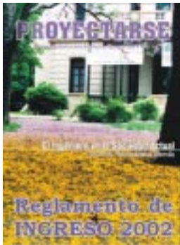
Frente del edificio central, al- fombra de flores característi- ca del mes de diciembre.

Dirección de Relaciones con la Comunidad